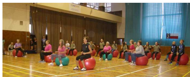
Program v Českých Budějovicích