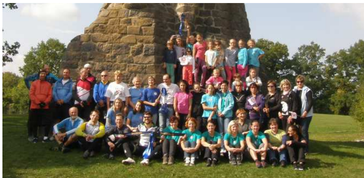
Setkání župních přípojek u Sudoměře