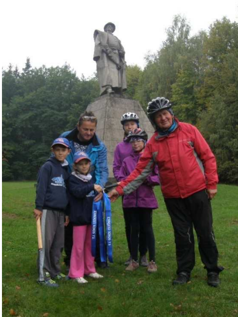
Start štafety v Trocnově

Jihočeši hlásí: trasa naší části Sletové štafety 2017 vedla z rodiště Jana Žižky v Trocnově přes sídlo župy v Českých Budějovicích, přes Žižkův památník slavné husitské bitvy u Sudoměře, přes Písek a Milevsko do Příbrami (předávka Sokolské župě Jungmannově). Na této trase urazil štafetový kolík Sokolské župy Jihočeské na kole, vlakem nebo během vzdálenost 234 km za doprovodu 49 kurýrů z osmi sokolských tělocvičných jednot. Na devíti župních přípojkách přidalo 139 členů dalších devíti sokolských jednot celkem 162 km. A to pěšky, na kole, na koloběžce, na in-line bruslích, na koni, vlakem nebo autem. Přes 60 členů a činovníků jednot přišlo účastníky štafety pozdravit nebo se podíleli na sportovně-kulturním programu v sokolovně v Českých Budějovicích. Celkem se tedy na průběhu štafety podílelo na 250 osob, z nichž 188 „mobilních“ účastníků urazilo téměř 400 km. O tom, že hlavně v sobotu nám byl nakloněn i svatý Petr, svědčí naše fotografie.